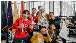
Orientasi mahasiswa baru yang sangat menyenangkan