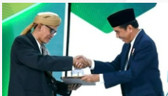
Serah terima gedung UNU pada saat Musyawarah Nasional NU di Jakarta