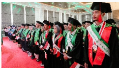
Wisuda Program Sarjana UNU Yogyakarta 2023