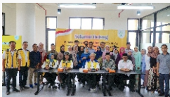
Kunjungan Menteri PUPR Dr. Ir. H. M. Basuki Hadimuljono, M.Sc.