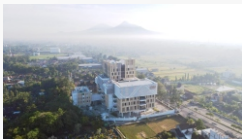
Potret gedung baru UNU Yogyakarta dengan pemandangan Gunung Merapi